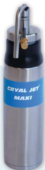
CRYAL JET maxi